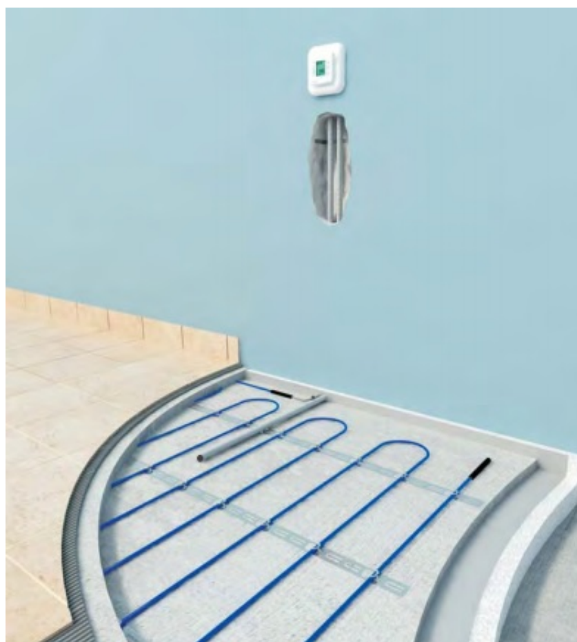
Mocowanie przewodu grzejnego ELEKTRA VCD za pomocą taśmy montażowej ELEKTRA TME

Po rozłożeniu przewodów instalujemy czujnik temperatury podłogi i zalewamy całą powierzchnię zaprawą piaskowo-betonową o grubości min. 50mm. Zamiast zaprawy piaskowo-betonowej można użyć zaprawy samopoziomującej. Należy zwrócić szczególną uwagę na to, aby początek i koniec przewodu grzejnego (czarne złącza) oraz przewód grzejny były całkowicie zatopione w zaprawie.