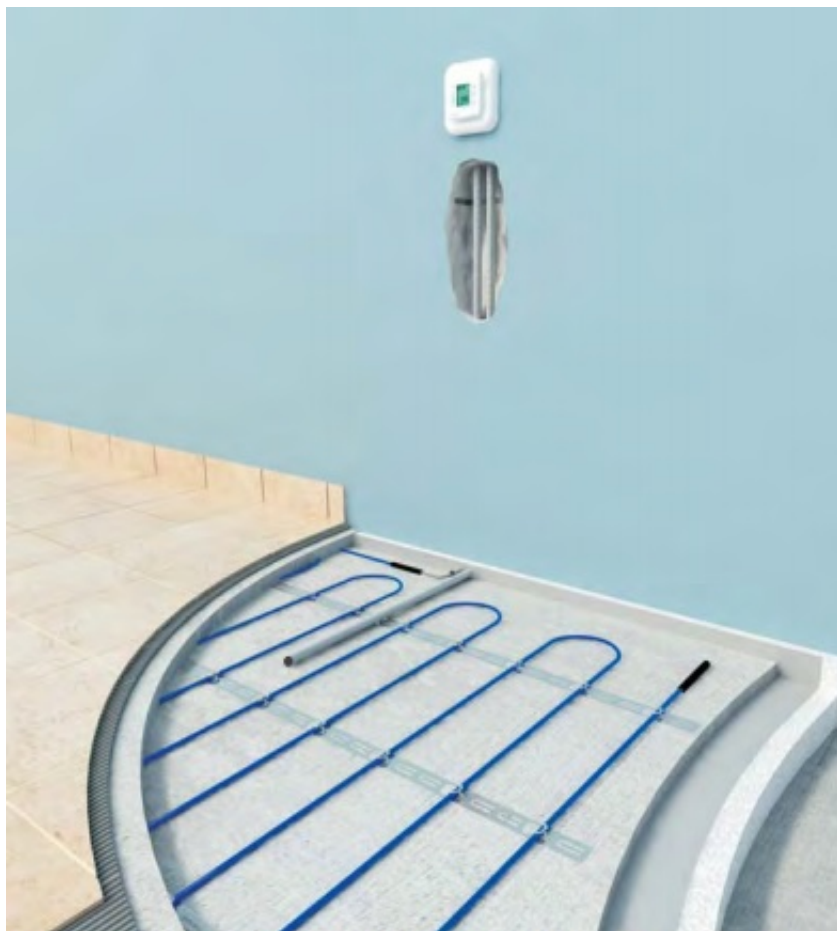
Mocowanie przewodu grzejnego ELEKTRA VCD za pomocą taśmy montażowej ELEKTRA TME

Po rozłożeniu przewodów instalujemy czujnik temperatury podłogi i zalewamy całą powierzchnię zaprawą piaskowo-betonową o grubości min. 50mm. Zamiast zaprawy piaskowo-betonowej można użyć zaprawy samopoziomującej. Należy zwrócić szczególną uwagę na to, aby początek i koniec przewodu grzejnego (czarne złącza) oraz przewód grzejny były całkowicie zatopione w zaprawie.