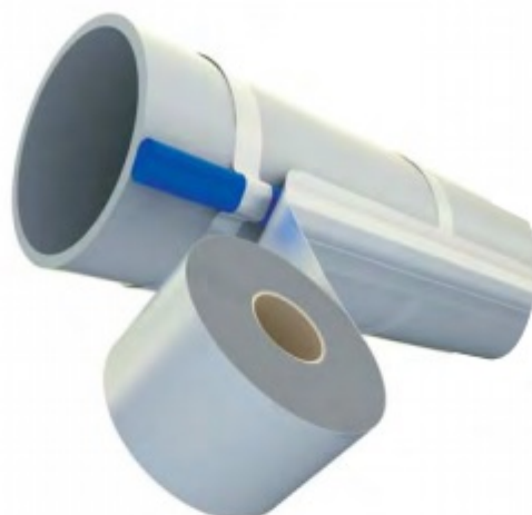
Montaż przewodu na rurze metalowej