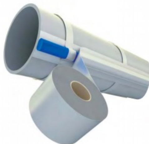
Montaż przewodu na rurze z tworzywa sztucznego

Przewody samoregulujące mogą się krzyżować, co znacznie ułatwia układanie przewodu na zaworach i kołnierzach. Ponadto, przewody samoregulujące można ciąć na dowolną długość dopasowaną precyzyjnie do długości rurociągu. Podczas układania samoregulujących przewodów grzejnych należy pamiętać o pozostawieniu zapasu przewodu na wykonanie połączenia z przewodem zasilającym (zimnym) - łącznie ok. 0,5m.