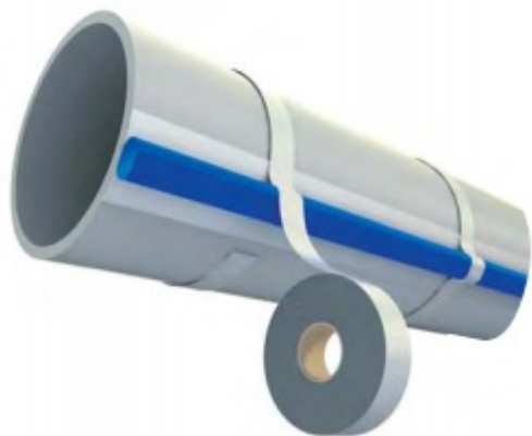
Montaż przewodu na rurze z tworzywa sztucznego